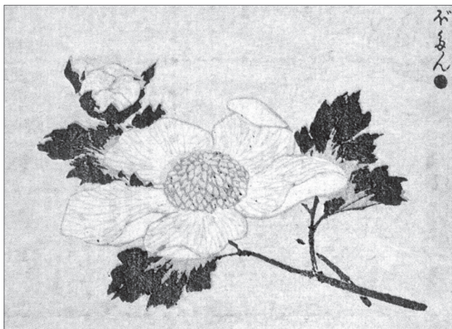
Le immagini a corredo del testo sono state scelte tra le opere di Hokusai